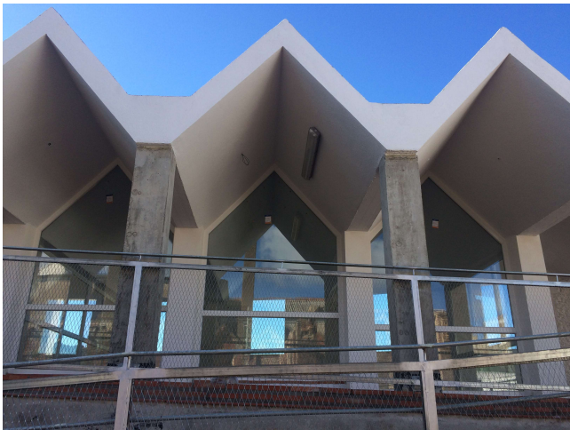
Exteriores del Hotel de Villaviciosa de Córdoba

Esta actuación ha consistido en la construcción de un Hotel municipal en el edificio de la antigua Alcoholera de Villaviciosa de Córdoba, integrando la edificación existente en el nuevo uso, poniendo en valor el conjunto como parte de su memoria histórica, rehabilitando parte de lo preexistente, colmatando con nueva edificación los vacíos actuales y utilizando como nuevo el patio de la antigua atarazana. Se encuentra localizado al sur del municipio en el borde del núcleo urbano presentando una única fachada curva al Camino del Tapón.