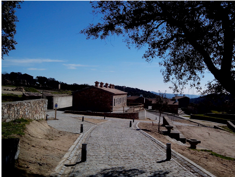
Urbanización Aldea del Cerezo

Se ha realizado la pavimentación de varios tramos mediante adoquinado, siguiendo las determinaciones específicas del planeamiento urbanístico para la Aldea de El Cerezo, que prohíben los materiales convencionales de pavimentación, permitiendo únicamente empedrados y firmes terrizos.