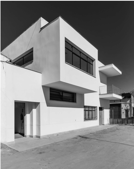
Exterior CIE Villanueva de Córdoba