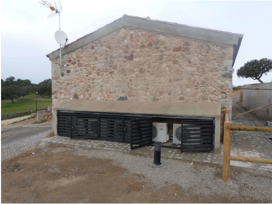
Instalación Exterior Aire Acondicionado módulo 5 hab.