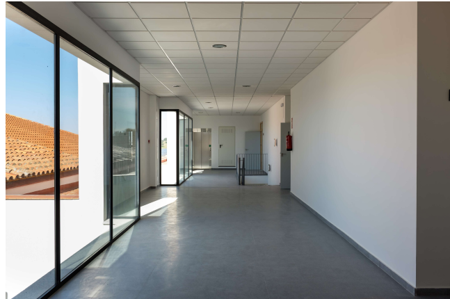
Interior CIE Villanueva de Córdoba