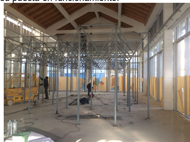
Interior CIE de Peñarroya - Pueblonuevo