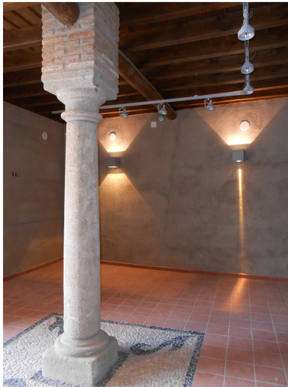
Interior del Museo

Por último, con objeto de poner en funcionamiento el museo se ha completado con equipamiento audiovisual, vigilancia y mobiliario.