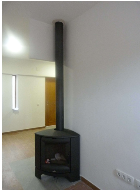
Alojamiento nº 1: Adaptado a Minusválidos. Chimenea