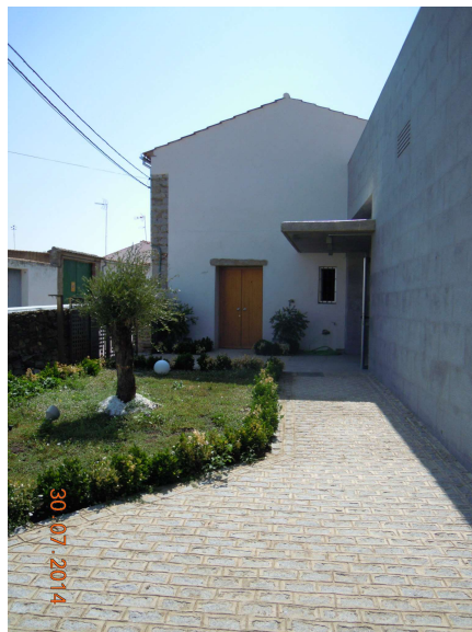
Exterior Centro Cívico

Se ha construido un Centro Cívico en el municipio de Villanueva del Duque en un solar de aproximadamente 829,66 m 2 , en el lugar donde se ubicaba la antigua molina, con dos piezas, una alineada al vial con forma de ele donde ubica la zona de exposiciones y otros de planta cuadrangular donde se ubica la biblioteca, aula y aseos, las cuales quedan unidas por un vestíbulo, dejando una plaza-patio de acceso. El edificio antiguo se ha rehabilitado manteniendo su organización espacial y funcional.