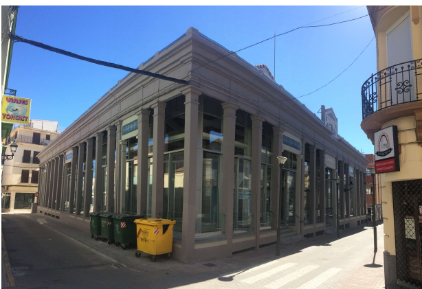
Exterior CIE Peñarroya – Pueblonuevo

Además de la construcción propiamente dicha se ha dotado en centro con el mobiliario y el quitamiento informático y audiovisual básico para su puesta en funcionamiento.