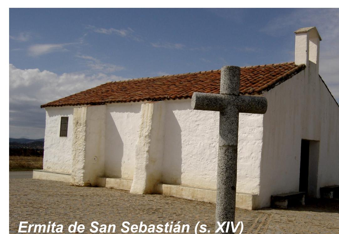
Ermita de San Sebastián (s. XIV)