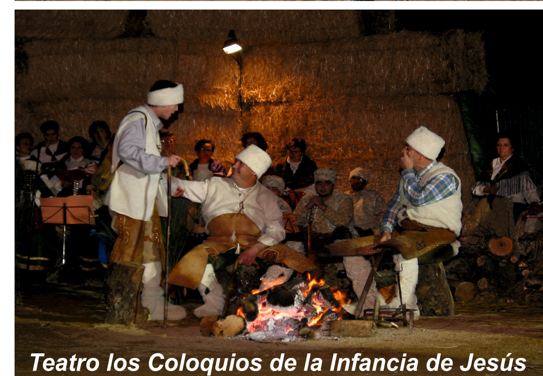
Teatro los Coloquios de la Infancia de Jesús

Datos de interés: Ayuntamiento Tlf: 957 15 60 09 Centro de Salud Tlf: 957 13 99 00 Punto de Información al Peregrino (Oficina Comarcal de Turismo) Tlf: 957 15 61 02 Guardia Civil Tlf: 957 15 60 33 Policía Local Tlf: 957 15 60 09