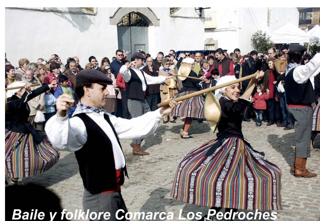
Baile y folklore Comarca Los Pedroches