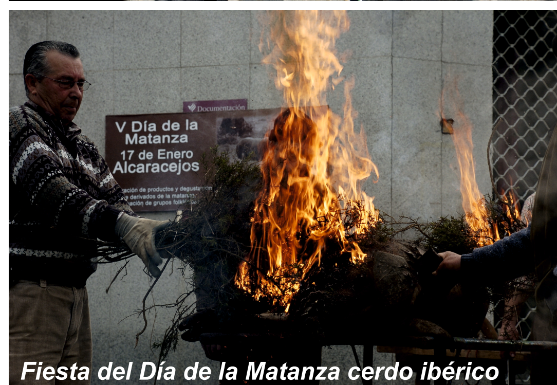
Fiesta del Día de la Matanza cerdo ibérico