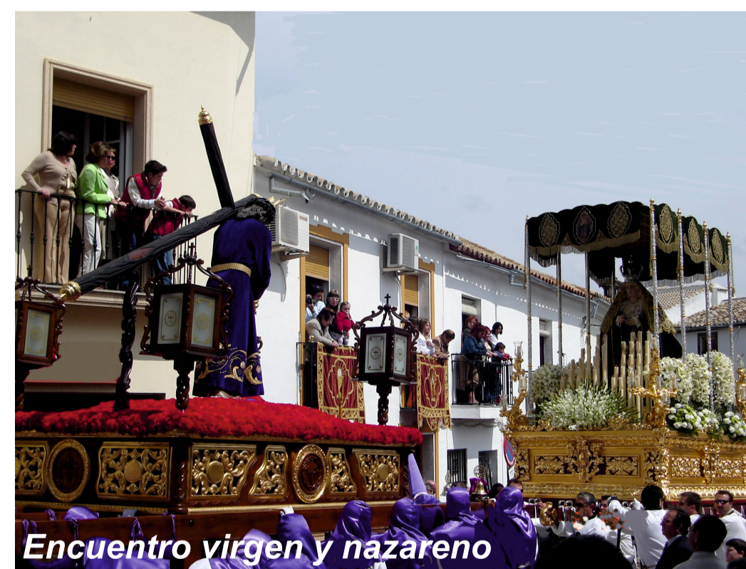
Encuentro virgen y nazareno