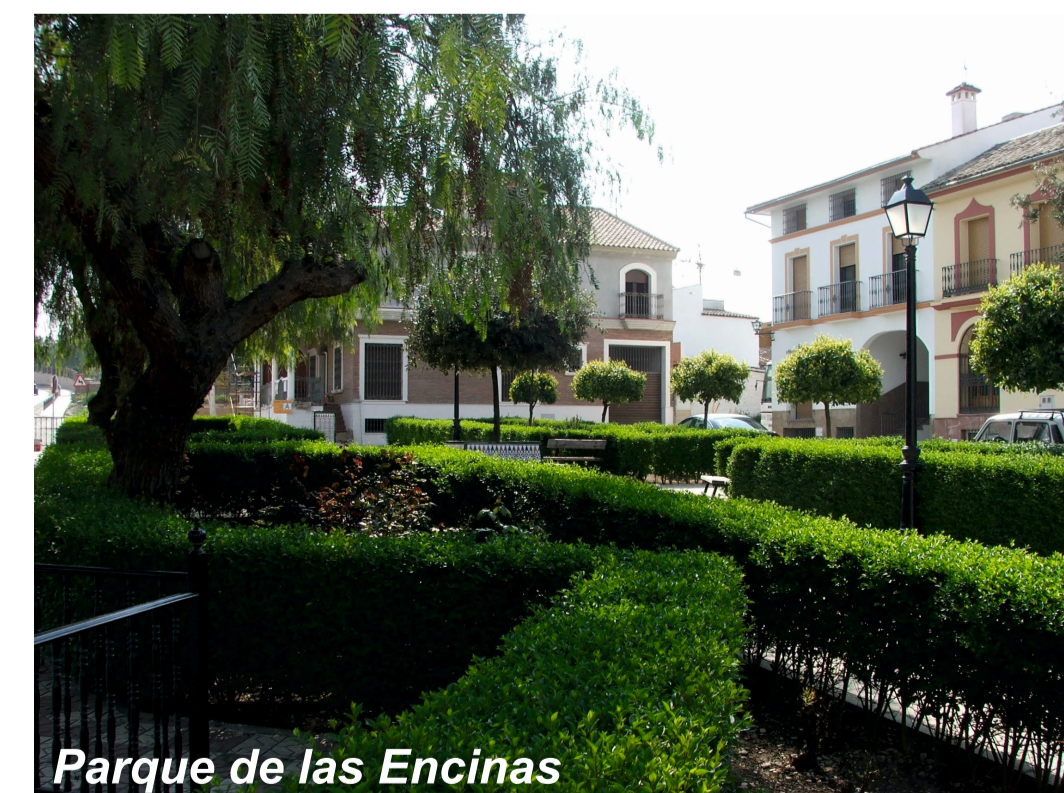
Parque de las Encinas