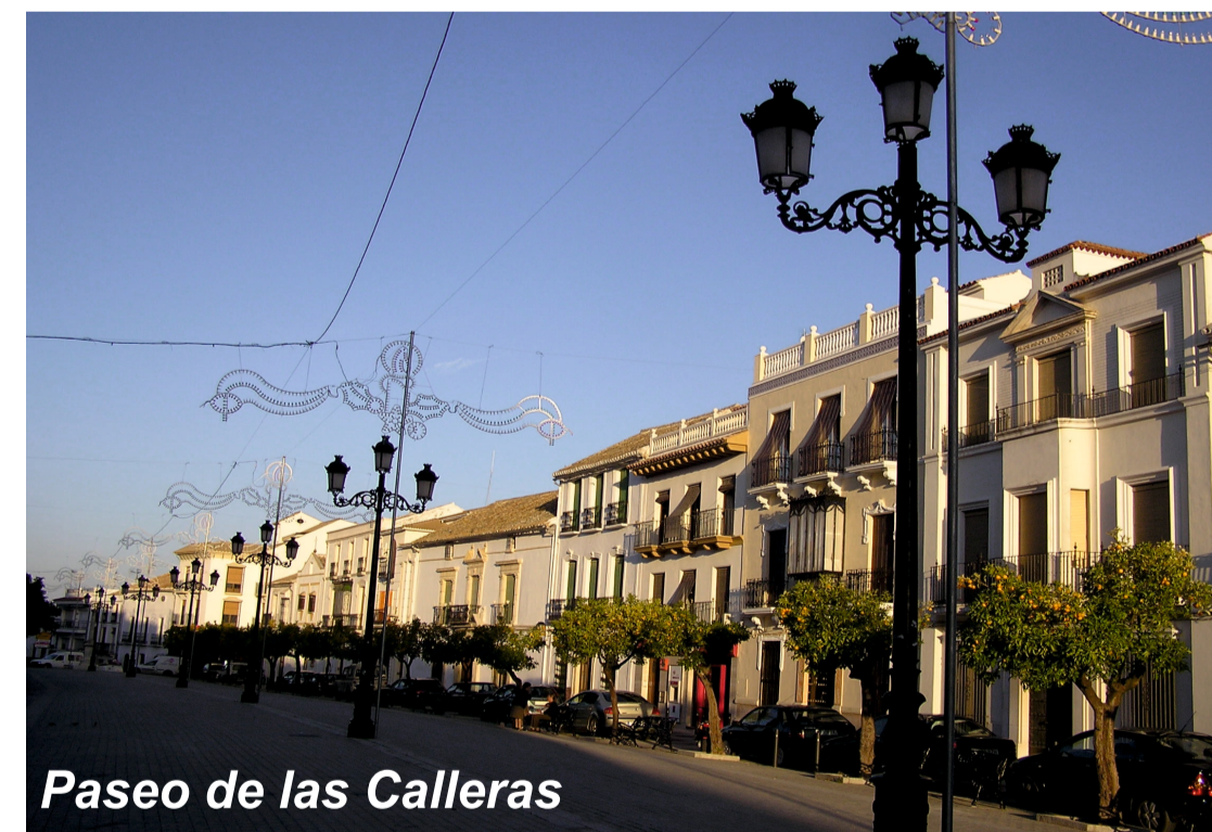
Paseo de las Calleras