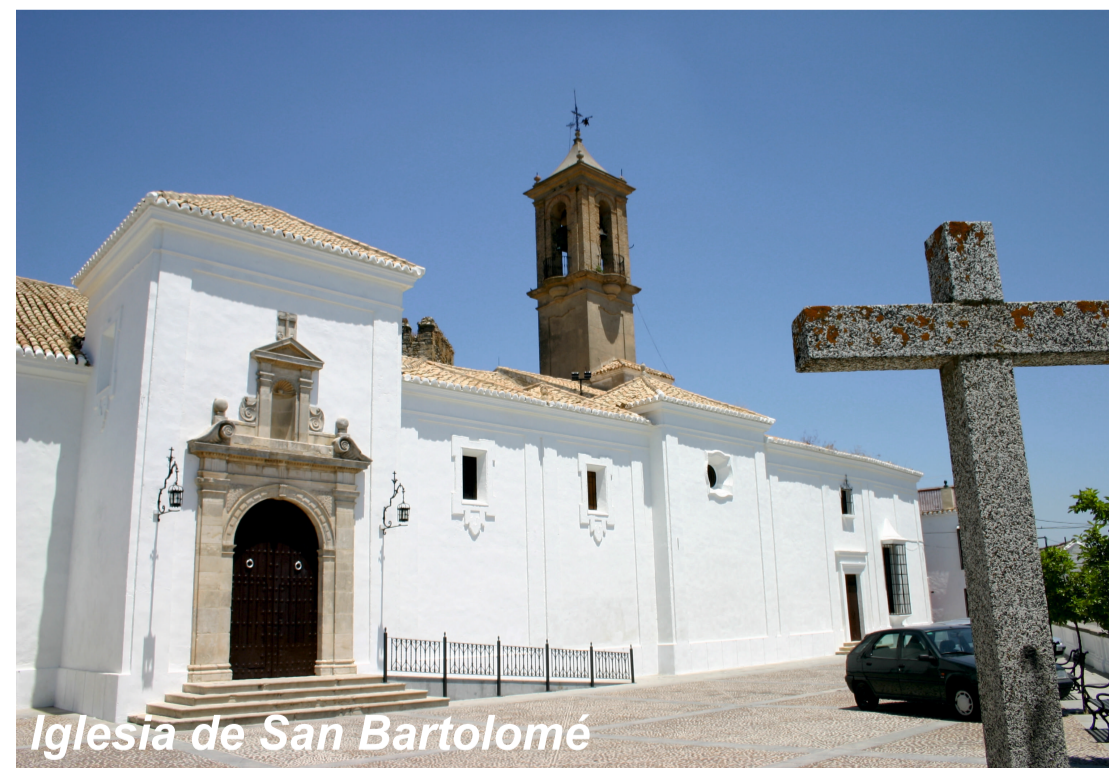
Iglesia de San Bartolomé