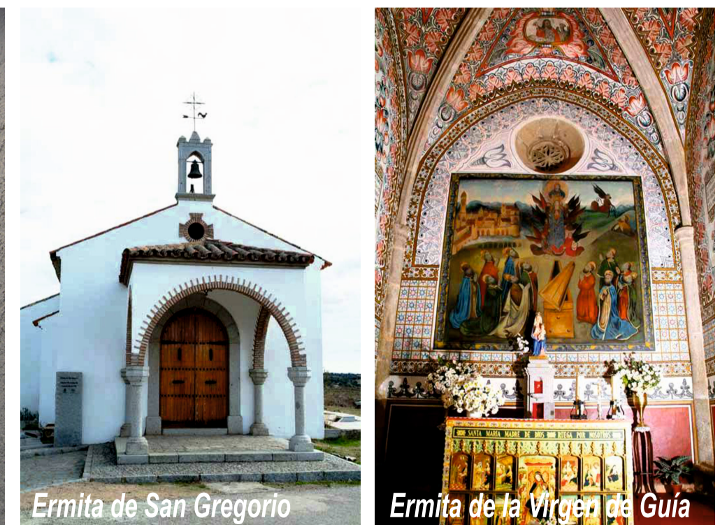
Ermita de San Gregorio