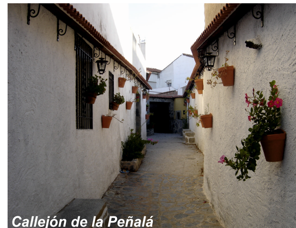
Callejón de la Peñalá