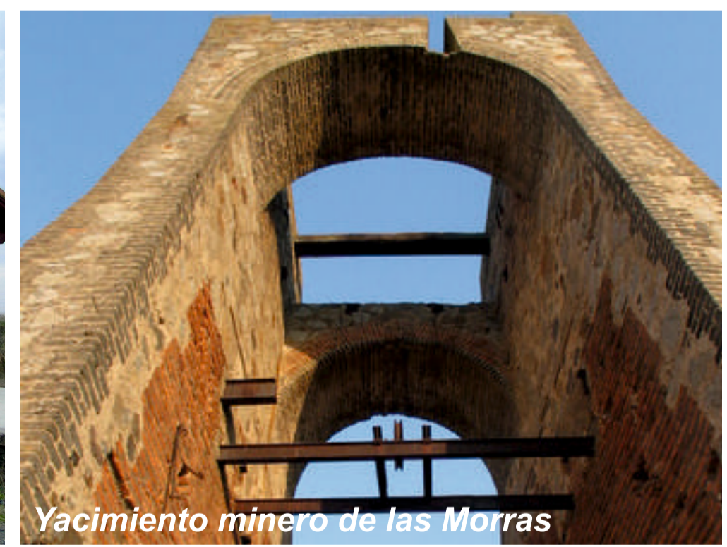
Yacimiento minero de las Morras