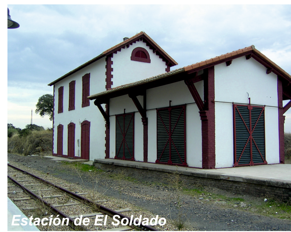
Estación de El Soldado