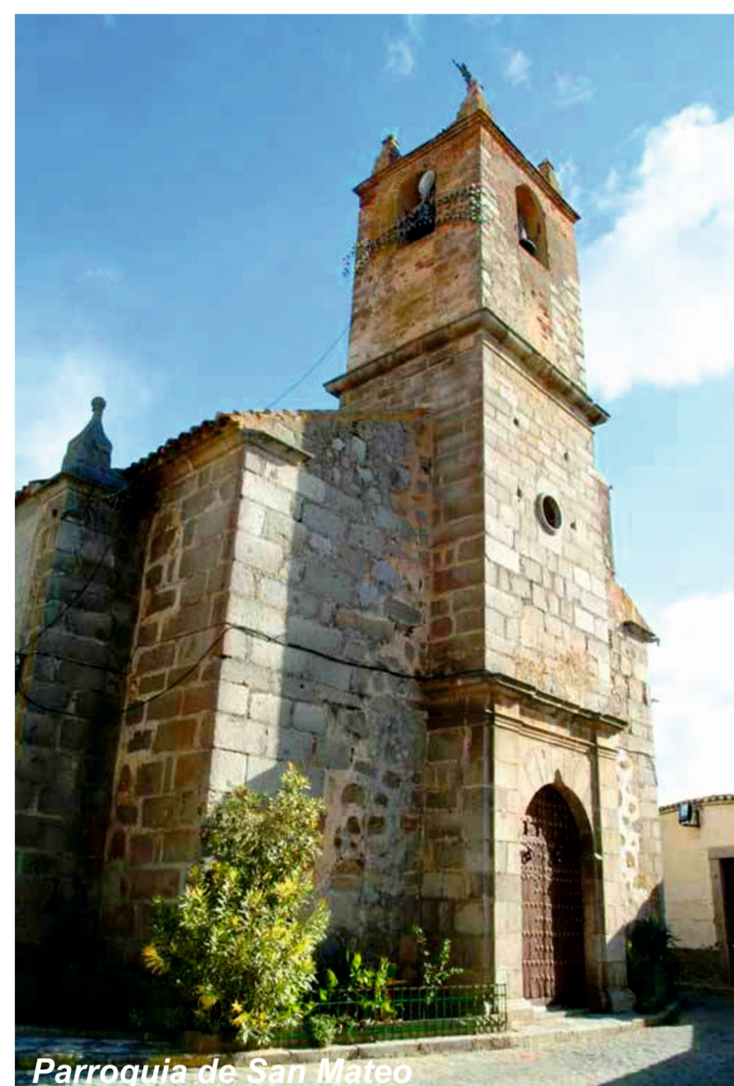
Parroquia de San Mateo