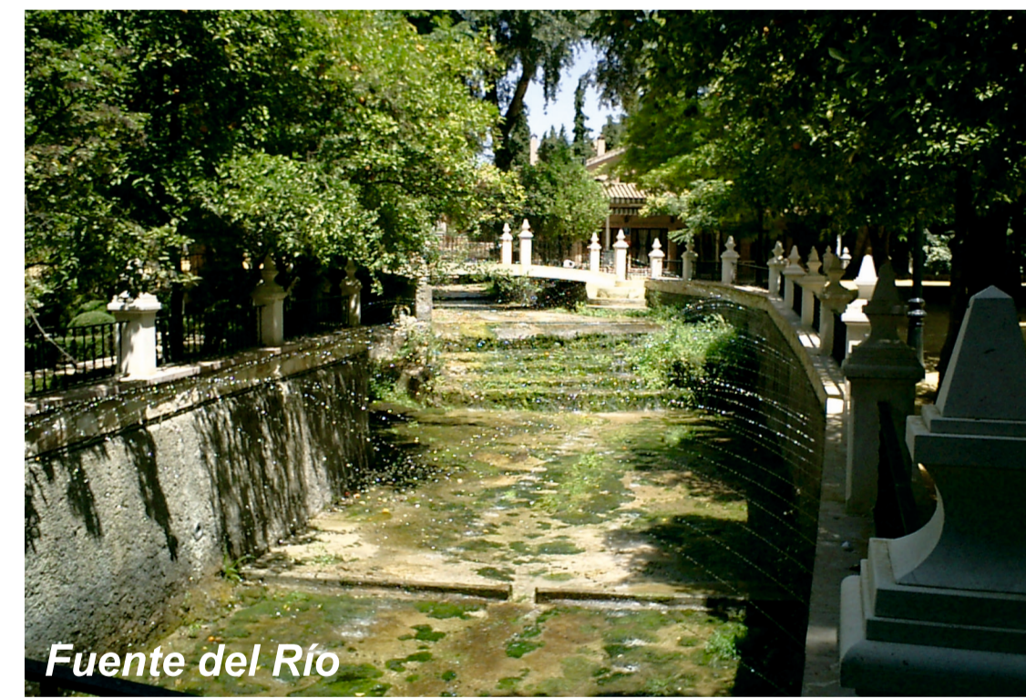
Fuente del Río